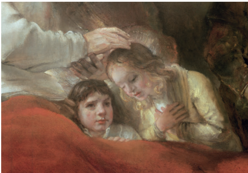
Jacob Blessing his Sons (Detail)