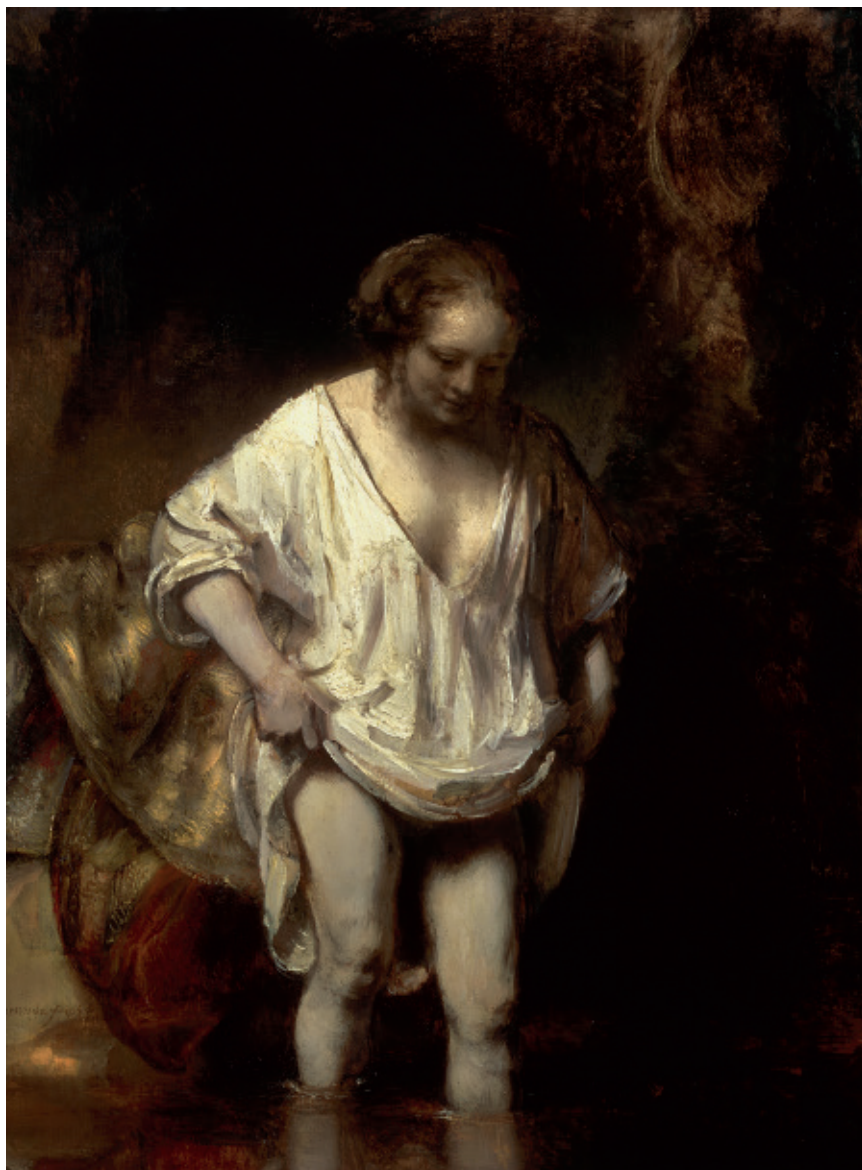
Hendrijke Bathing Κουραϊκί se Hendrickje Hendrickje v kúpeľi Hendrickje w kąpielu Hendrijke ímbãindu-se Η Χεντρίγκε στο λουτρό

1654, Oil on wood/olej na dřevě/ olej na dreve/olej na desce/ ulei pe lemn/λάδι σε ξύλο 61,8 × 47 cm National Gallery, London