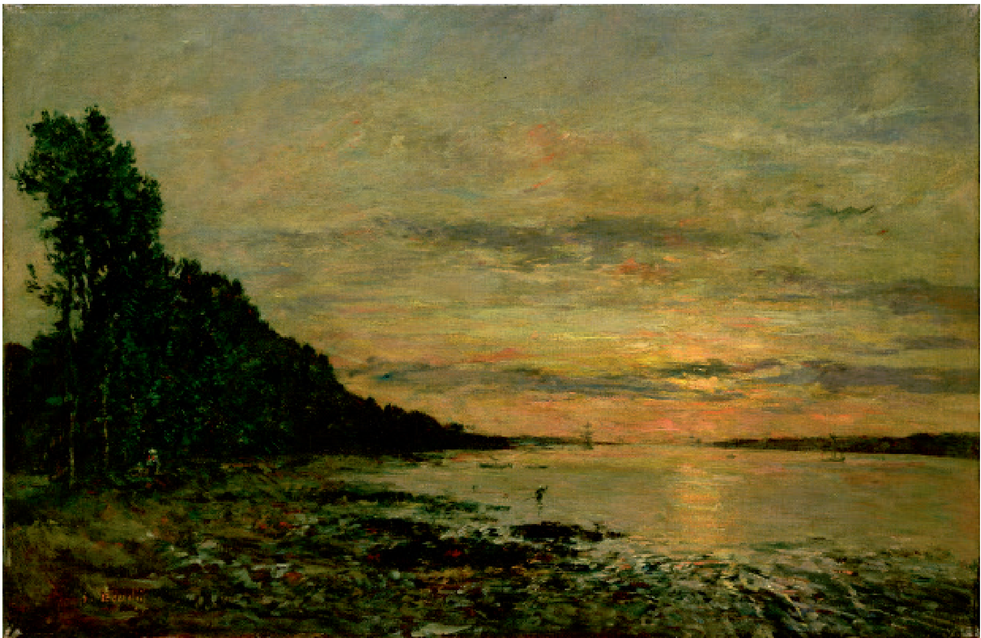
Plougastel-Daoulas Plougastel-Daoulas Plougastel-Daoulas Plougastel-Daoulas Plougastel-Daoulas Plougastel-Daoulas Eugène Boudin (1824–1898) c. 1870–1873, Oil on canvas/olej na plátně/olej na plátne/olej na plótnie/ulei pe pânzã/λάδι σε καμβά, 52 x 80 cm, Private collection