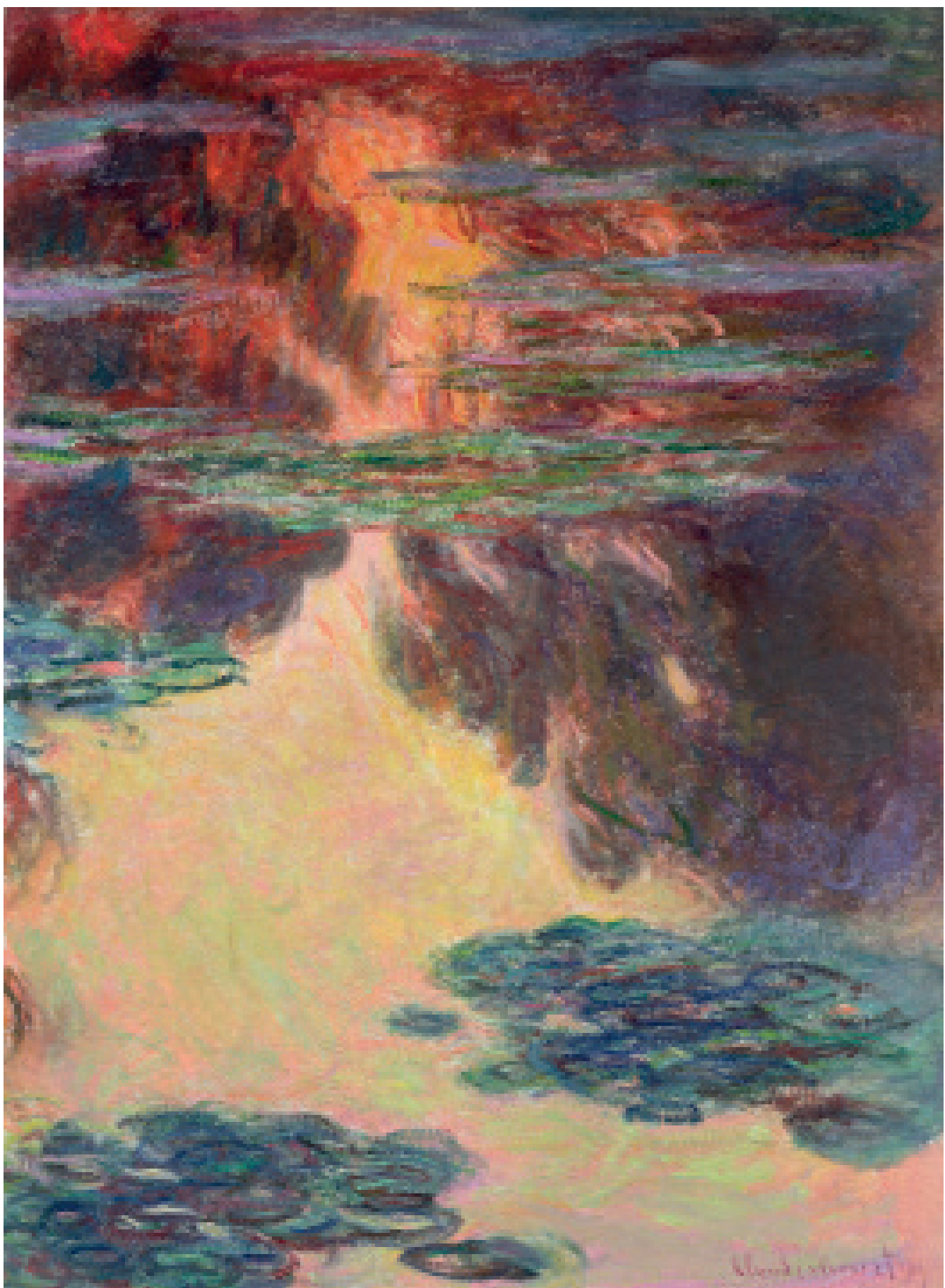
Water Lilies Lekníny Lekná Nenufary Nuferi Νούφαρα

1907, Oil on canvas/olej na plátně/olej na plátne/ olej na plótnie/ulei pe pânzã/λάδι σε καμβά, 100 x 73 cm, Musée Marmottan Monet, Paris