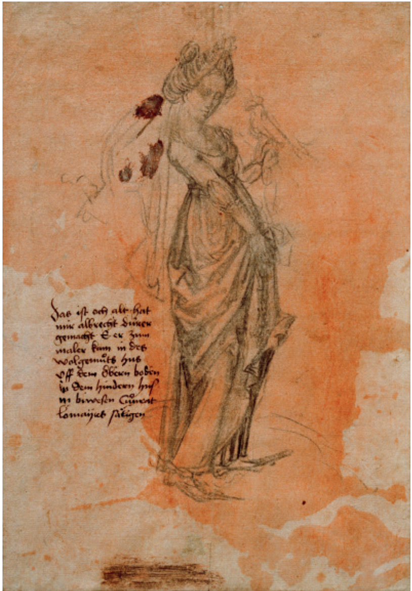
The Lady with the Falcon